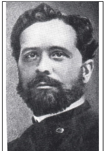
Georg Baumgarten 1837 – 1884 Grünaer Oberförster und Luftfahrtpionier

Sonntag, 30.9.2018, Start 9.00 Uhr: Wanderung durch das Revier des Fliegenden Oberförsters mit dem Natur- und Wanderverein Grüna über 8 oder 16 km; Start/Ziel Folklorehof